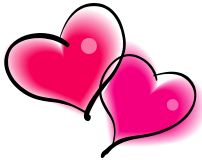
Table d'hôte St-Valentin/ Valentine's Day Special (Full meal)